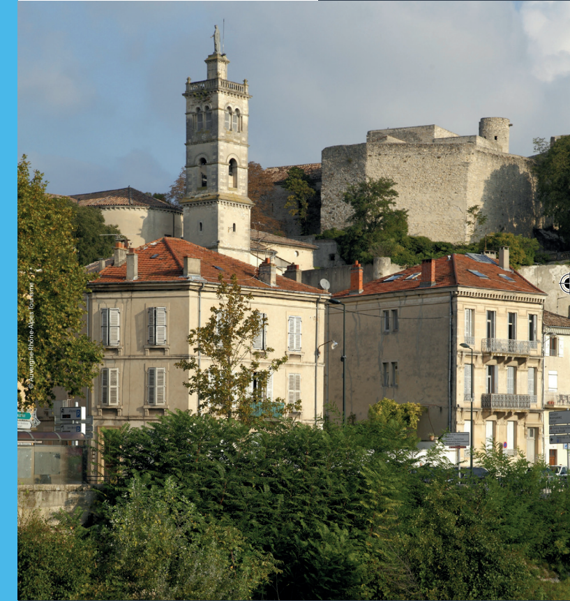
Les Cars de la Région Auvergne-Rhône-Alpes

La Région vous transporte À partir du 1 er septembre 2022